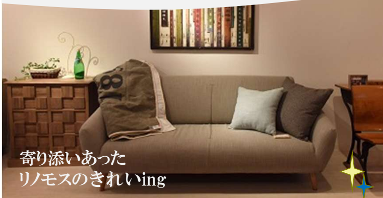
寄り添いあった リノモスのきれいing