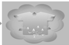
洗濯物の水分が周りの乾いた空気に移動