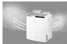
空気中の湿気を衣類乾燥除湿機で回収