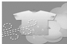
洗濯物に風をあて水分の移動をさらにうながす

ニオわせない部屋干しのコツ 梅雨の時期に面倒な家事ランキング第1位のお洗濯。ライフスタイルが多様化している現代では、部屋干しすることは家事の負担を減らし、暮らしやすくする工夫のひとつ。部屋干しのコツをまとめました。