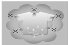
周りの空気が高温になると水分が移動できない